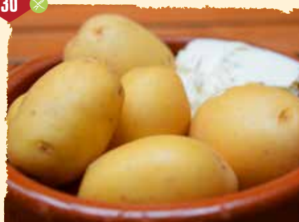
Patatas con queso (warm) Kartoffeln mit Frischkäse