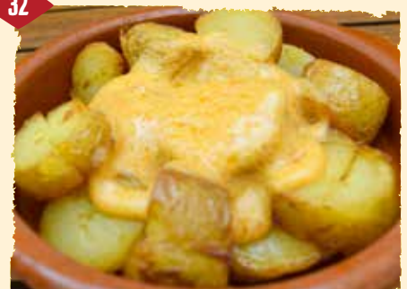
Patatas bravas (warm) Frittierte Kartoffelecken mit Salsa Brava 2