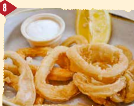
Calamares fritos (warm) Frittierte Calamari 10