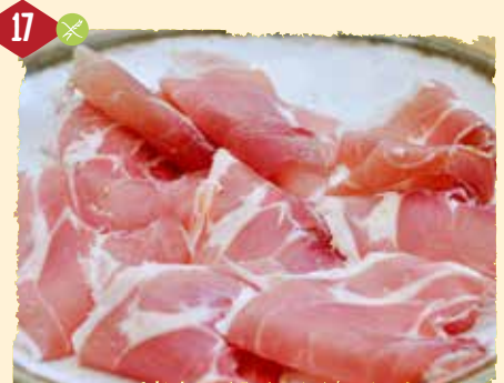
Jamón serrano (kalt) Serranoschinken dazu 2 Scheiben Brot 2,48