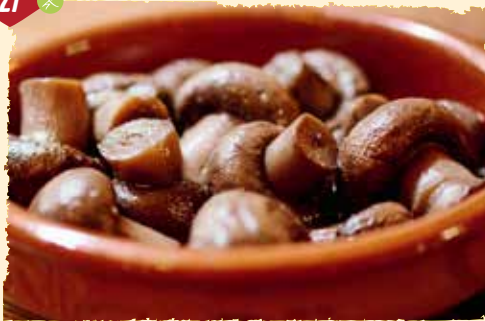
Champiñones al ajillo (warm) Knoblauchchampignons