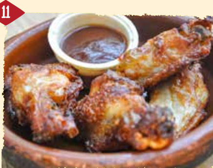
Pollo picante (warm) Hühchenflügel mit Chili-Barbecuesoße