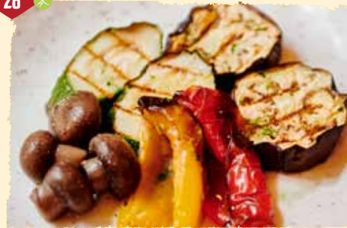
Verduras mixtas (kalt) Gegrilltes Gemüse in Kräuteröl 2,8