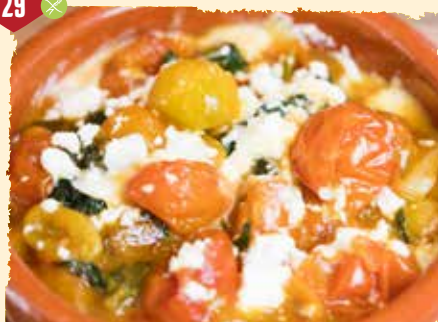
Tomatenragout (warm) Mit Fetakäse und Blattspinat