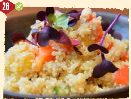
Quinoa con ensalada (kalt) Urgetreide, Mango, Gemüsesalat