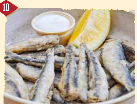
Boquerones (warm) Frittierte Sardellen