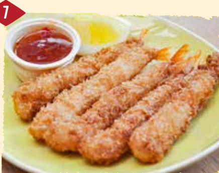
Gambas empanadas (warm) Garnelen im Teigmantel 10